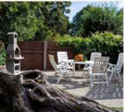
Einrichtungsbeispiele aus dem swalphenhus