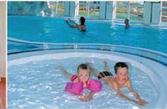
Familienspaß im Schwimmbad